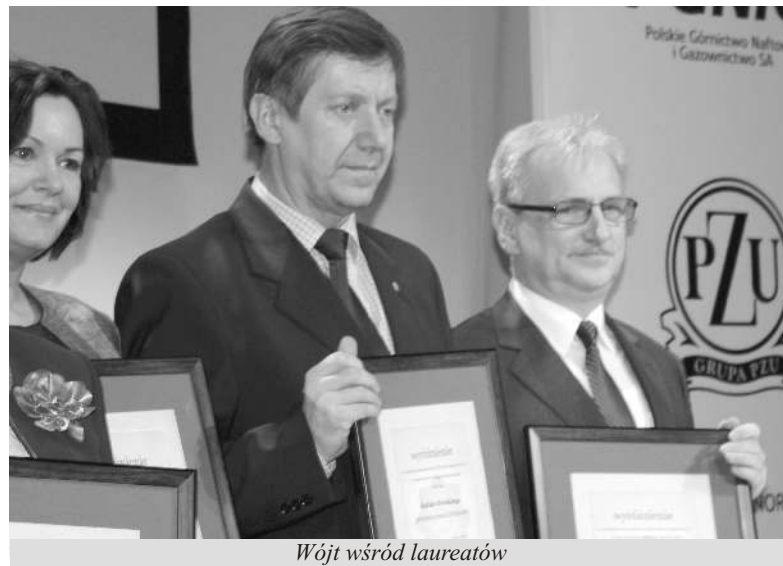
Wójt wśród laureatów

Ranking sporządzany jest na bazie opinii wszystkich samorządów lokalnych (miejskich i wiejskich), które między sobą wyłaniają samo-