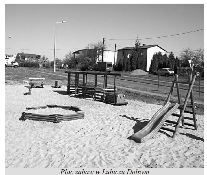
Plac zabaw w Lubiczu Dolnym