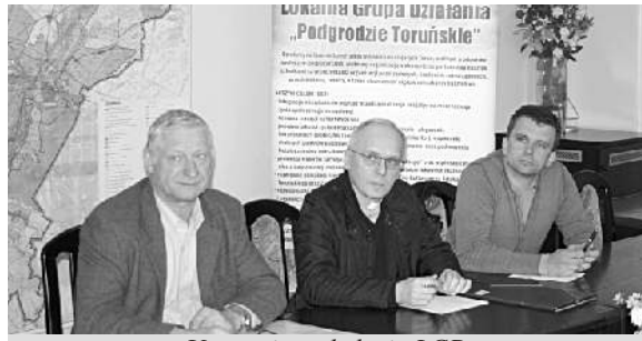
Uczestnicy szkolenia LGD

strowanych w KRS organizacji społecznych, parafii oraz podmiotów gospodarczych i osób fizycznych z terenu naszej gminy. Dotacje można wykorzystać m.in. na: organizację festynów wiejskich, turniejów sportowych, budowę małej architektury turystycznej, remonty świetlic wiejskich oraz ich wyposażenie, renowację kapliczek, promocję lokalnego dziedzictwa kulturowego, zakup ekspozycji do muzeów wiejskich, promocję produktów lokalnych, czy wreszcie wykorzystanie energii pochodzącej ze źródeł odnawialnych dla poprawy warunków działalności gospodarczej.