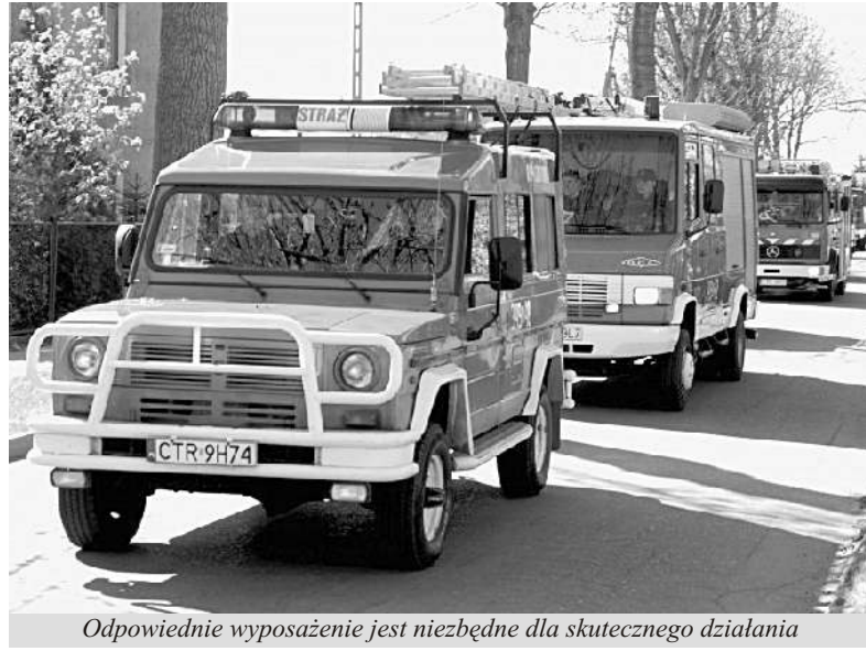
Odpowiednie wyposażenie jest niezbędne dla skutecznego działania

Obecnie Ochotnicza Straż Pożarna to bardzo dobrze wyszkolone i nowoczesnie wyposażone jednostki, które odgrywają niezwykle istotną rolę w systemie pożarnictwa i ratownictwa. Usytuowanie jednostek OSP sprawia, że bardzo często pojawiają się na miejscu pożaru lub innego zdarzenia zanim zdążą dotrzeć tam jednostki Państwowej Straży Pożarnej. Także charakter i położenie Gminy Lubicz, wymusza na naszych strażakach stałe poszerzanie zakresu swoich umiejętności. Mamy tereny typowo rolne, jak i zakłady przemysłowe oraz strefy mocno zurbanizowane. Przez teren Gminy Lubicz przebiegają ważne i ruchliwe trasy komunikacyjne, na których często dochodzi do niebezpiecznych wypadków.