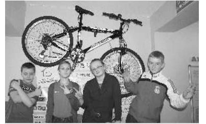
Uczniowie przy głównej nagrodzie w konkursie

W tym roku stowarzyszenie opracowało nową formułę projektu i po raz pierwszy realizuje ją na taką skalę. Każda placówka dostała