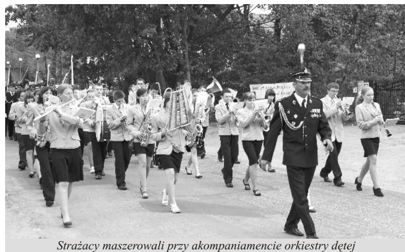
Strażacy maszerowali przy akompaniamencie orkiestry dętej

Więcej o działalności gminnej OSP piszemy na stronie 3.