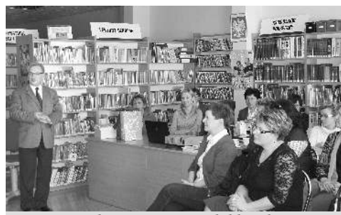
Podczas prezentacji biblioteki

doświadczeń instytucji biorących udział w Programie Rozwoju Bibliotek. Bibliotekarki zapoznały się z działalnością naszych placówek i były pod wrażeniem zasobów biblioteki oraz funduszy przeznaczanych na zakup nowości wydawniczych. Chwaliły siedzibę biblioteki gminnej, ładny, przestronny lokal i jego świetną lokalizację w centrum miejscowości.