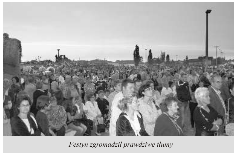
Festyn zgromadził prawdziwe tłumy

Wakacyjny sezon w gminie Lubicz zakończył się niezwykle mocnym akcentem. Dnia 1 września br. na terenie Zespołu Szkół Nr 1 w Lubiczu Górnym odbył się gminny Festyn Dożynkowy. Liczba mieszkańców, którzy uczestniczyli w imprezie, a także mnogość atrakcji jaką zapewnili organizatorzy Festynu sprawiły, że na długo zapadnie on w naszej pamięci.