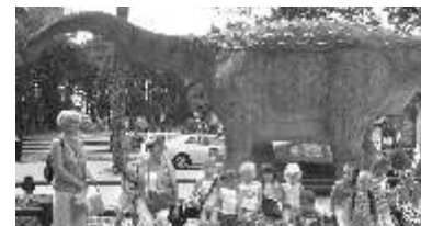
JuraPark w Solcu Kujawskim

Łącznie dzieci uczestniczyły w 6 wycieczkach: do stadniny Młyńska Struga w Grabowcu, do