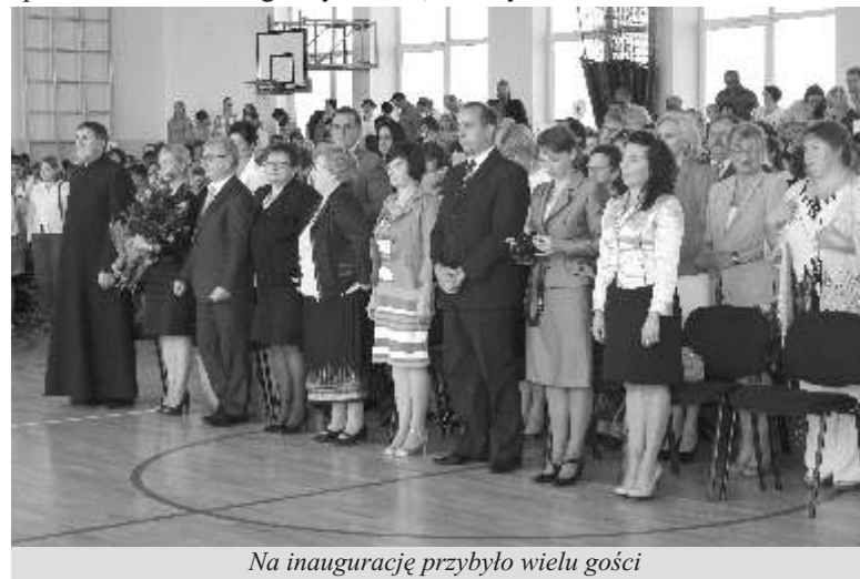
Na inaugurację przybyło wielu gości

Wszystkim uczniom z terenu gminy Lubicz życzymy roku pełnego zdrowia i sukcesów naukowych.