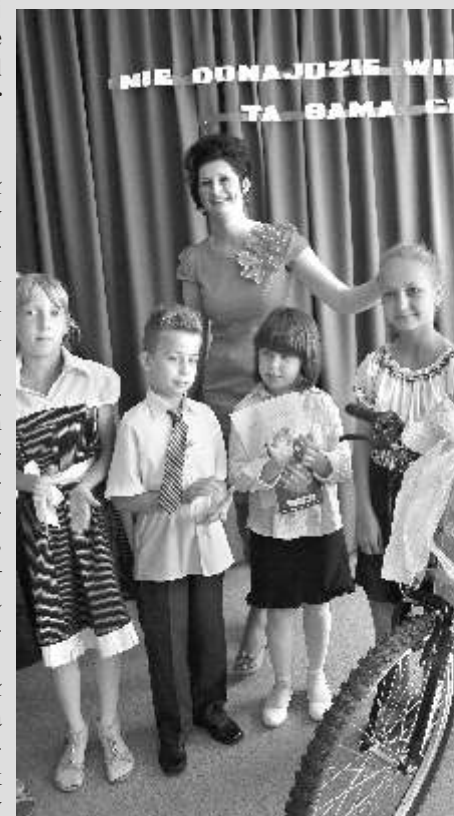
Laureatka obok głównej nagrody