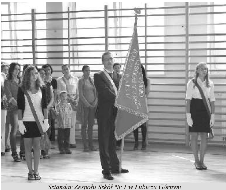
Sztandar Zespołu Szkół Nr 1 w Lubiczu Górnym

Dnia 3 września br. po wakacyjnej przerwie uczniowie z gminy Lubicz powrócili do szkolnych ław, rozpoczynając nowy rok szkolny 2012/2013.