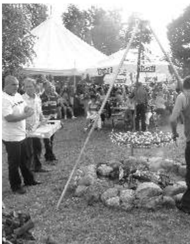
Pieczenie kiełbask w Kopaninie

W okresie letnim w gminie Lubicz odbyło się wiele imprez plenerowych i festynów rodzinnych.