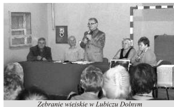
Zebranie wiejskie w Lubiczu Dolnym