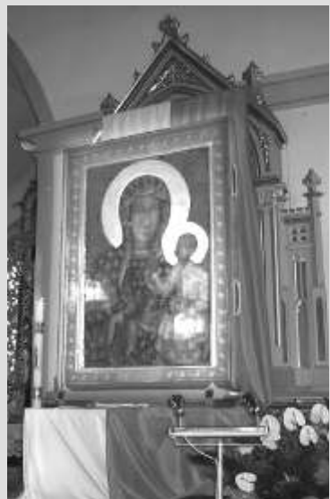
Kopia Obrazu Matki Boskiej Częstochowskiej w kościele w Złotorii

We wszystkich wsiach, do których zawitała Kopia Obrazu odbyły się specjalne nabożeństwa i procesje głównymi ulicami miejscowości, w których licznie uczestniczyli mieszkańcy gminy. Kopia Obrazu Matki Boskiej Częstochowskiej powróciła do gminy Lubicz po przeszło ćwierćwieczu.