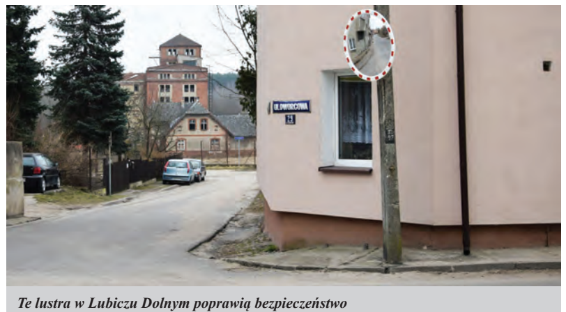
Te lustra w Lubiczu Dolnym poprawią bezpieczeństwo