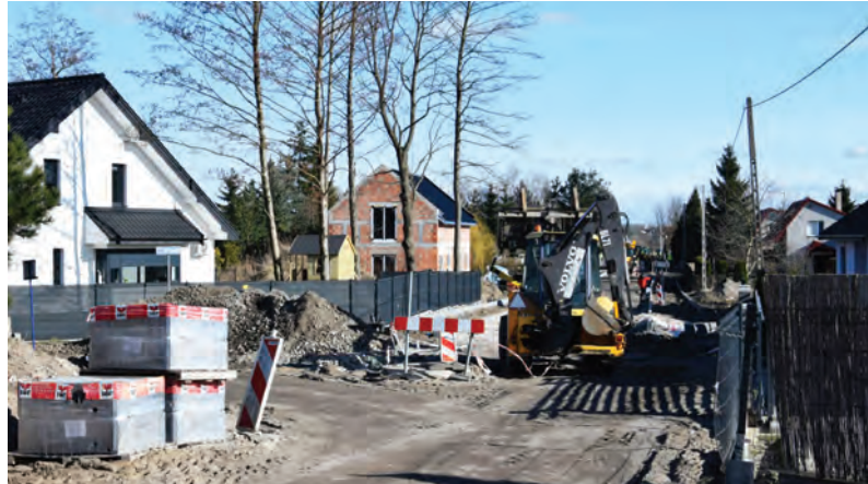
Budowa ul. Toruńskiej w Grębocinie

Jedną z najważniejszych obecnie, nowych inwestycji drogowych w gminie jest budowa ul. Toruńskiej na granicy Grębocina i Torunia. To przedsięwzięcie, niezwykle ważne i długo wyczekiwane przez mieszkańców, pochłonie ok. 5,4 mln zł z budżetu gminy, miasta Toruń i Funduszu Dróg Samorządowych. Inna z drogowych inwestycji w kwietniu powinna zostać ukończona – to ul. Osikowa w Krobi. Ciepłe dni pozwalają także na wznowienie prac ziemnych, stąd aktywność naszych pracowników w Gronowie (odwodnienie rowu), Grębocinie (podobna sytuacja), Lubiczu Dolnym, gdzie właśnie rozpoczęła się budowa ok. 500-metrowego odcinka wodociągu dla posesji w okolicach ul. Zbożowej i Dworcowej. Podobna inwestycja będzie miała miejsce na ul. Chmielnej w Grębocinie.