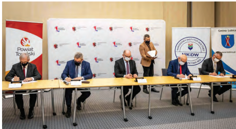
Podpisanie listu intencyjnego wyrażającego chęć współpracy przy tworzeniu centrum wieloetniczności.