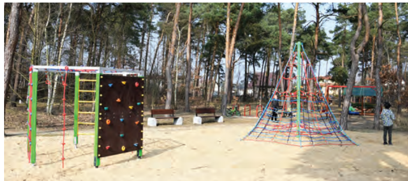
W parku znalazły się m.in. huśtawki, bujaki sprężynowe, linarium czy tory sprawnościowe.