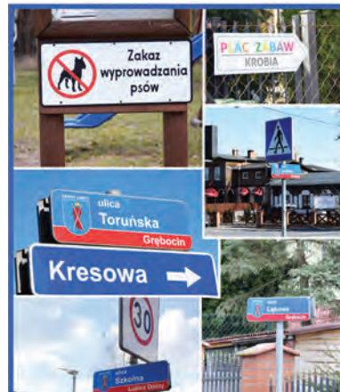
Nowe oznakowanie naszych ulic

Wiosna sprzyja odnowieniu oznakowania ulic i miejsc publicznych. Stąd w wielu sołectwach zamontowaliśmy kolejne strzałki kierunkowe lub inne tablice informacyjne, usprawniające docieranie do celu. Jeśli w Państwa otoczeniu są takie potrzeby, prosimy o zgłaszanie ich do sołtysów, uzupełnimy. Funkcjonują już także progi zwalniające w Krobi, a fotowoltaiczne lampy zostały ustawione przy ul. Baśniowej i Żwirka i Muchomorka. Wcześniej z powodu zmrożonego gruntu nie było to