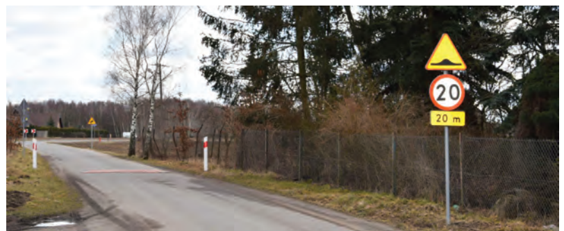
Nowe progi spowalniające, montowane na wniosek mieszkańców i sołtysa