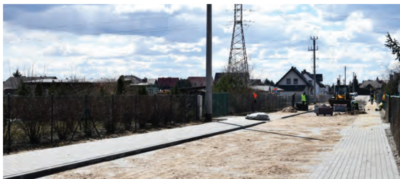
Modernizacja ul. Osikowej w Krobi