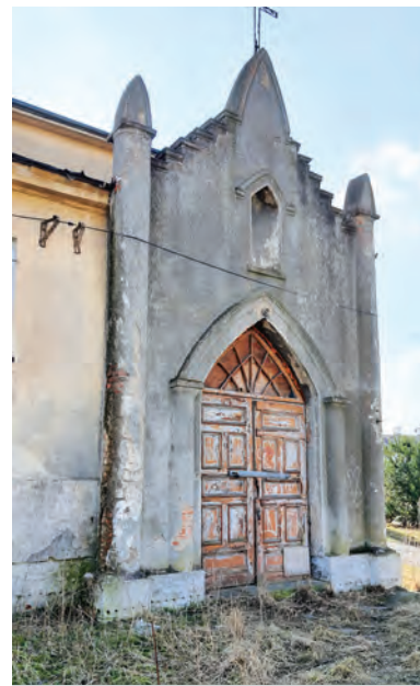
Kaplica katolicka funkcjonowała w tym budynku do lat 70. XX wieku

W obiekcie mieściła się komora celna po stronie rosyjskiej, potem należał on do Państwowej Służby Uzupelnień, a do lat 70. XX w. była tu kaplica katolicka.