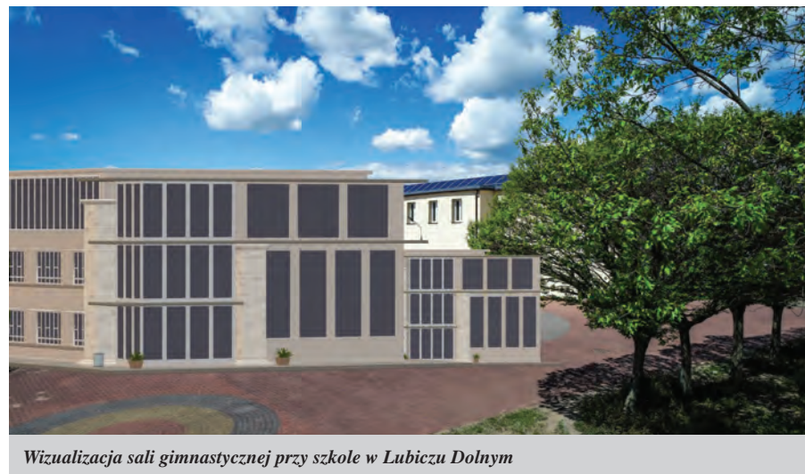
Wizualizacja sali gimnastycznej przy szkole w Lubiczu Dolnym