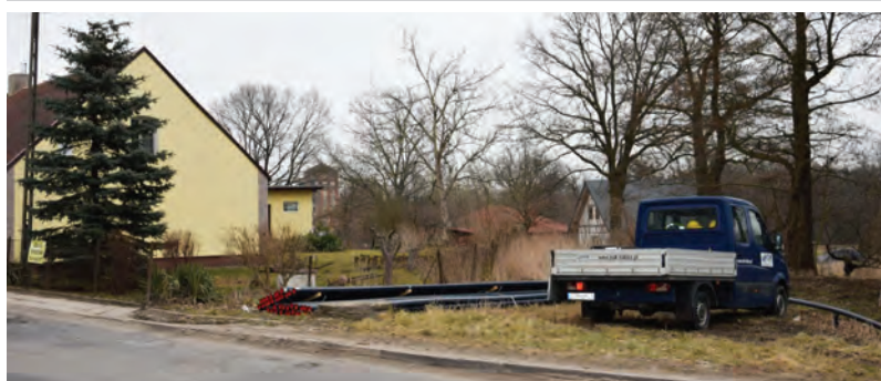
Rozbudowa sieci wodociągowej

no dwa lustra drogowe, które mają poprawić bezpieczeństwo w tym miejscu.