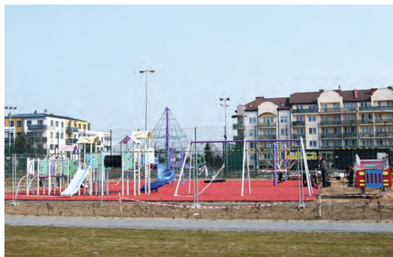
Nowoczesny plac zabaw w Lubiczu Górnym jeszcze przed ukończeniem.

Inwestycja jest dofinansowana z pieniędzy unijnych. (KM)