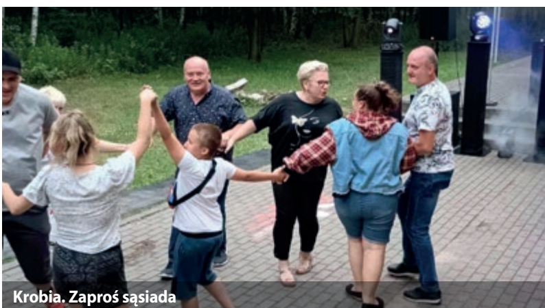
Krobia. Zaprosz sąsiada