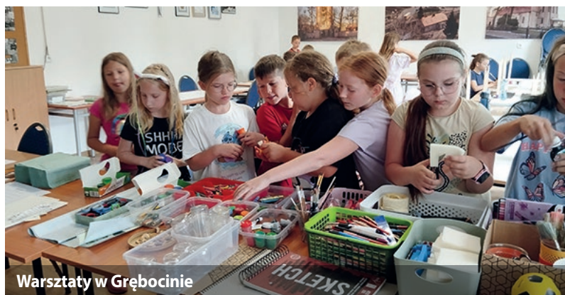
Warsztaty w Grębocinie