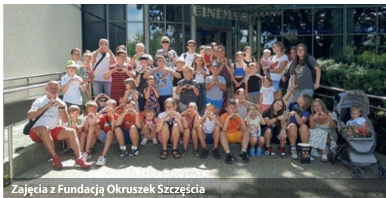
Zajęcia z Fundacją Okruszek Szczęścia

Wykaz zajęć w świetlicach w roku szkolnym znajdziecie na www.lubicz.pl