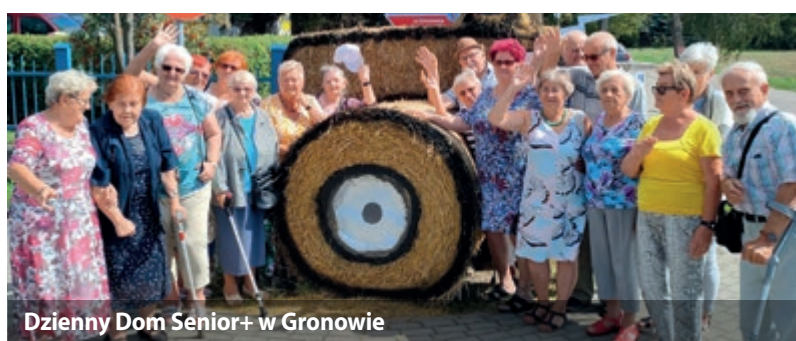
Dzienny Dom Senior+ w Gronowie