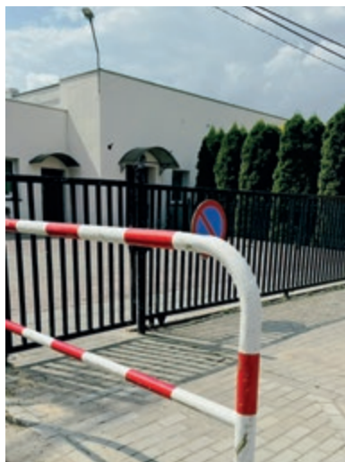
Przed świetlicą w Rogówku Zakład Usług Komunalnych ułożył kostkę i zamontował barierkę. Sołectwo kupiło także siatki do bramek, ławki, huśtawki i doposażyło świetlicę