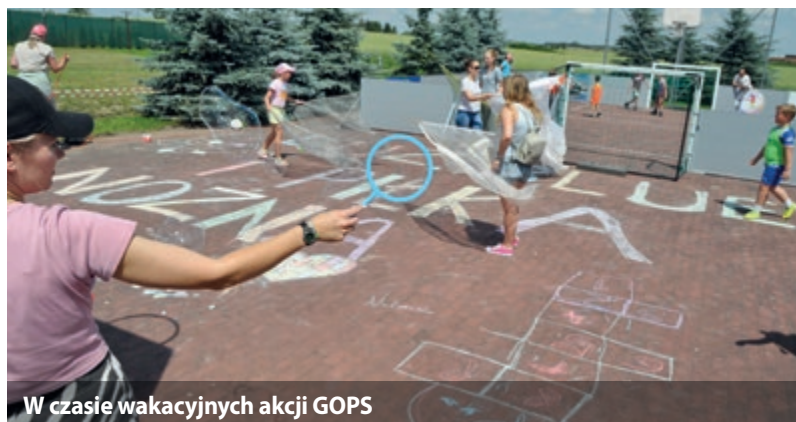
W czasie wakacyjnych akcji GOPS