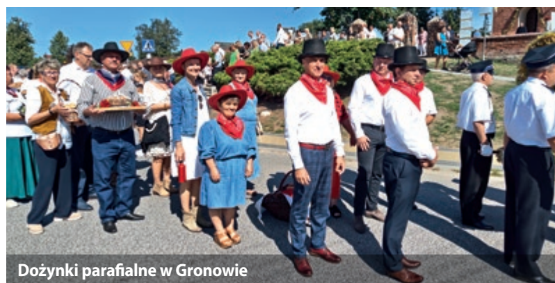
Dożynki parafialne w Gronowie