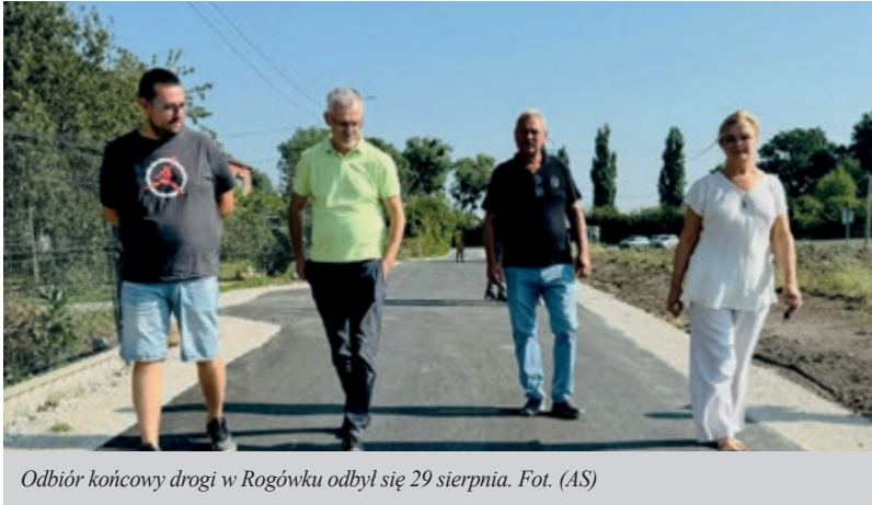
Odbiór końcowy drogi w Rogówku odbył się 29 sierpnia.