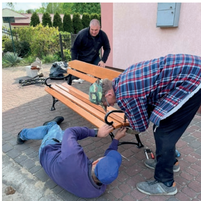
Kopanino m.in. doposażyło plac zabaw, kupiło ławki i świetniki oraz posadziło kwiaty przy świetlicy