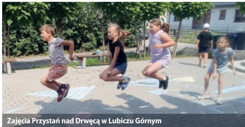
Zajęcia Przystań nad Drwęcą w Lubiczu Górnym