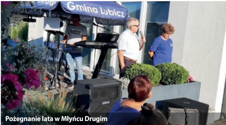
Pożegnanie lata w Młyńcu Drugim