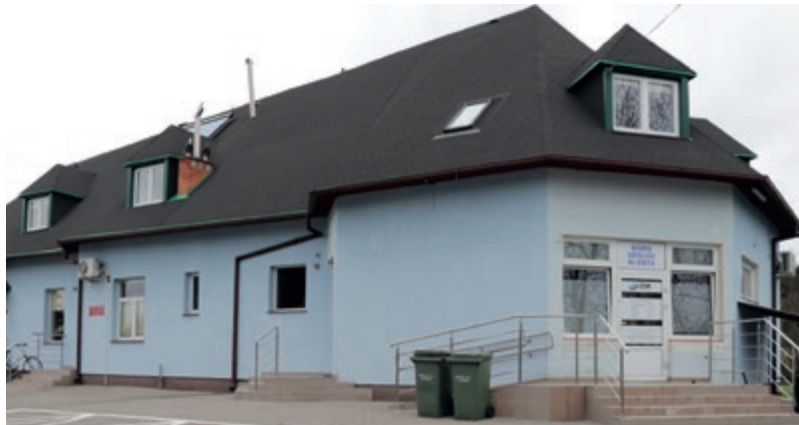
Zgłoszenia należy dostarczyć do Biura Obsługi Klienta ZUK, który znajduje się przy ul. Toruńskiej 56 w Lubiczu Dolnym.

Jeśli nielegalnie pobierasz wodę lub odprowadzasz ścieki, teraz masz szansę, aby to zmienić bez żadnych konsekwencji. Zakład Usług Komunalnych ogłasza abolicję!