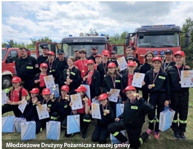
Młodzieżowe Drużyny Pożarnicze z naszej gminy