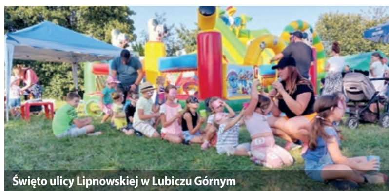
Święto ulicy Lipnowskiej w Lubiczu Górnym