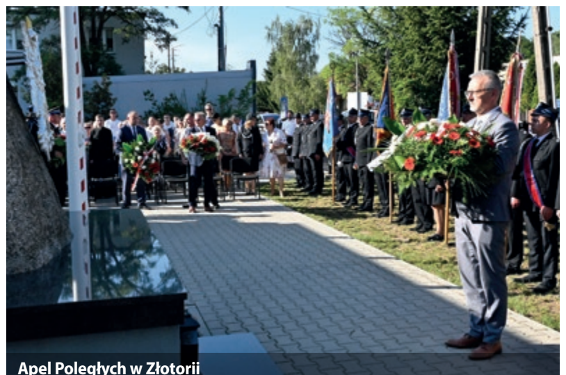
Apel Poległych w Złotorii