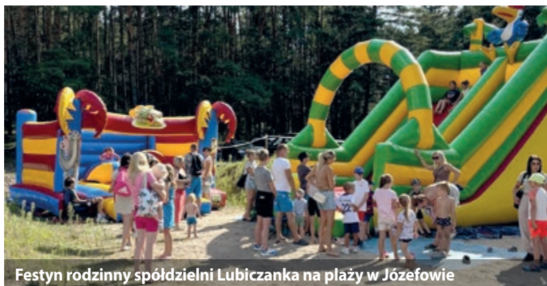
Festyn rodzinny spółdzielni Lubiczanka na plaży w Józefowie