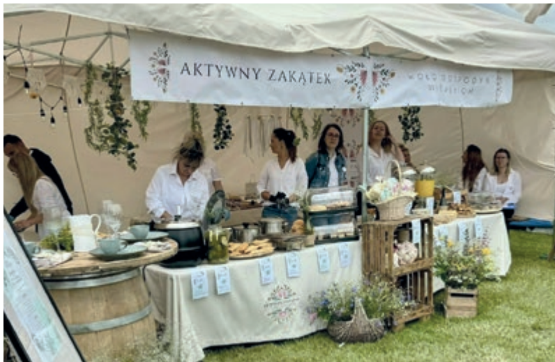
Stoisko „Aktywnego Zakątka” zwyciężyło w Golubiu-Dobrzyniu.

Koło Gospodyń Wiejskich „Aktywny Zakątek” z Lubicza Dolnego zwyciężyło w pierwszym etapie IX edycji Konkursu Kulinarного dla Kół Gospodyń Wiejskich „Bitwa Regionów”. Jury doceniło winne żeberka w kwiatowej odsłonie.