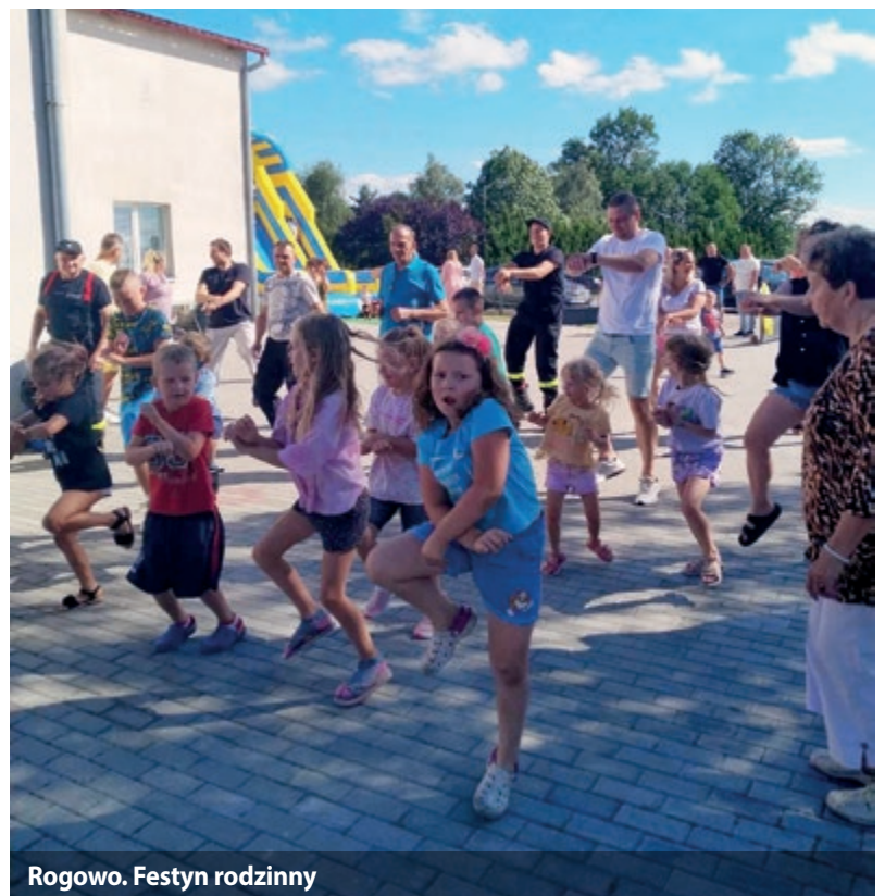
Rogowo. Festyn rodzinny