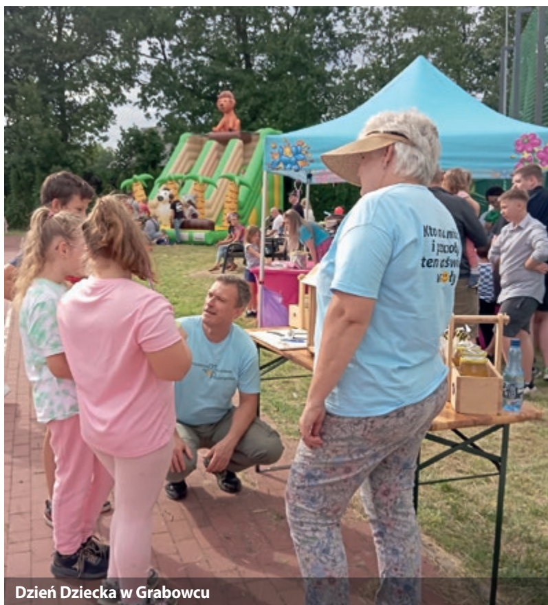
Dzień Dziecka w Grabowcu