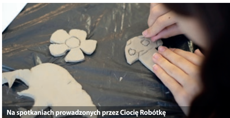
Na spotkaniach prowadzonych przez Ciocię Robótkę