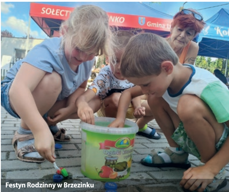
Festyn Rodzinny w Brzezinku