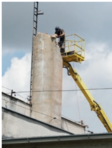
Burzenie komina na remizie lubickich strażaków

W lipcu rozpoczęła się przebudowa byłej sali gimnastycznej szkoły w Lubiczu Dolnym. Dzięki temu powstanie Centrum Usług Społecznych i nowa świetlica wiejska dla sołectwa, a remiza zostanie zmodernizowana.