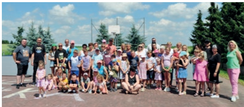
Większość sołectw przeznaczyła także część pieniędzy na dofinansowanie wakacyjnych pikników i akcji dla mieszkańców, np. Sołectwo Brzeźno, które włączyło się w wydarzenie „Luz, blues i piłka nożna”

Na zdjęciach znajdziecie Państwo przykłady wykorzystania tegorocznego funduszu sołeckiego, uchwalonego rok temu.