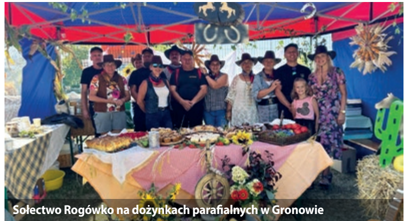
Sołectwo Rogówko na dożynkach parafialnych w Gronowie