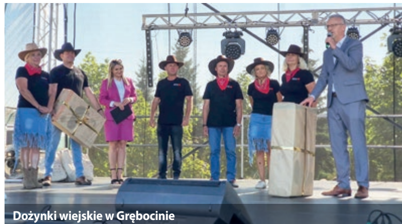
Dożynki wiejskie w Grębocinie