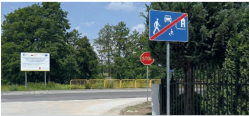
Na „osiedlu kwiatowym” obowiązuje znak strefa zamieszkania