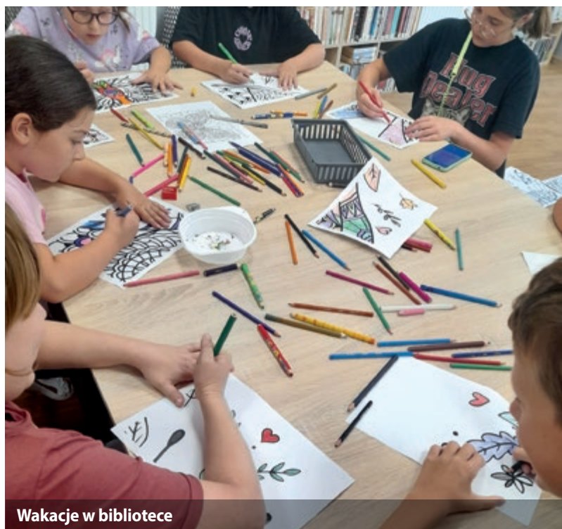
Wakacje w bibliotece