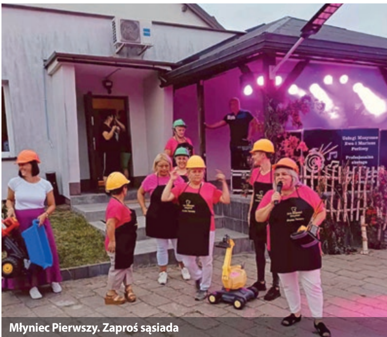
Młyniec Pierwszy. Zaprosz sąsiada