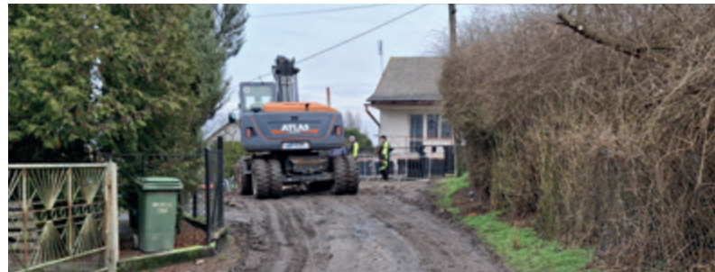
Budowa kanalizacji w ul. Zdrojowej w Lubiczu Górnym.

Kontynuujemy rozbudowę infrastruktury wodno-kanalizacyjnej. W naszej gminie powstają kolejne odcinki w Krobi i w Lubiczu Górnym, co znacząco poprawi komfort życia w tych miejscowościach.