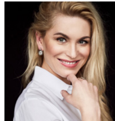
Katarzyna Bonda.

Katarzyna Bonda, najpopularniejsza autorka powieści kryminalnych w Polsce, przyjedzie na spotkanie autorskie w Złotorii na zaproszenie Gminnej Biblioteki Publicznej.