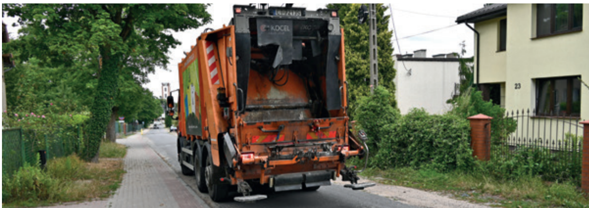
Miejskie Przedsiębiorstwo Oczyszczania w Toruniu wywozi teraz śmieci zmieszane co drugi tydzień

Wracamy do tematu odbioru odpadów w naszej gminie. Od nowego roku śmieci zmieszane wywozimy raz na dwa tygodnie i taki właśnie system obowiązuje w większości gmin wiejskich w Polsce.