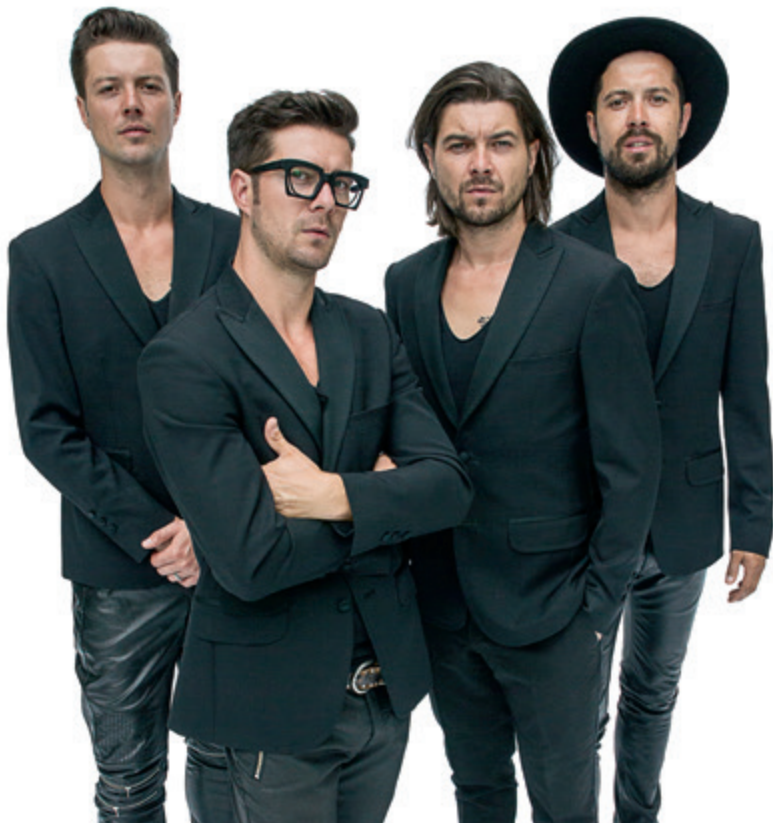
Zespół Pectus to czterech bracia Szczepanik.

W tym roku z okazji Dnia Kobiet zabierzemy panie na spacer po malowniczych zakątkach Barcelony! Bo „Barcelona” to jeden z najbardziej znanych przebojów tegorocznego gościa naszego wydania, czyli zespołu Pectus!