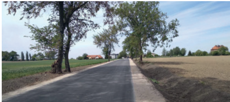
Rogówko. Tak wygląda gminna droga po przebudowie.

Z tymi, którzy jeszcze nie słyszeli, dzielimy się dobrymi wieściami. Urząd pozyskał dodatkowe, znaczne dofinansowanie z Rządowego Funduszu Dróg Samorządowych na drogi w Rogówku i Lubiczu Dolnym, a ostatnio w Złotorii.