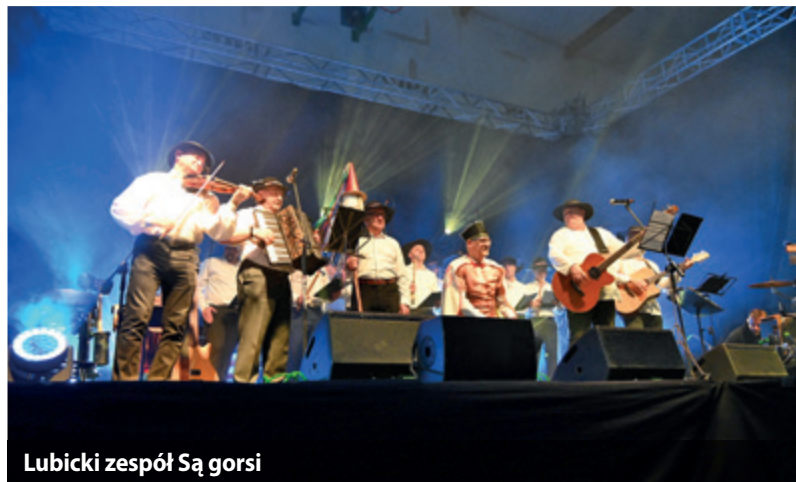
Lubicki zespół Sągorski

Zespół Pectus rozgrzał scenę na Gminnym Święcie Kobiet w Lubiczu Górnym! Owacji na stojąco nie zabrakło także podczas występu lubickiego zespołu Sągorski. Takich emocji i pozytywnej energii było nam potrzeba!