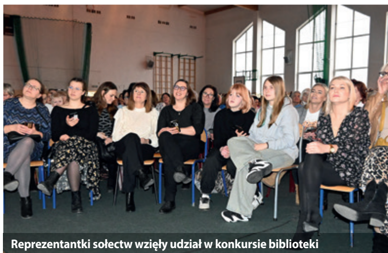
Reprezentantki sołectw wzięły udział w konkursie biblioteki