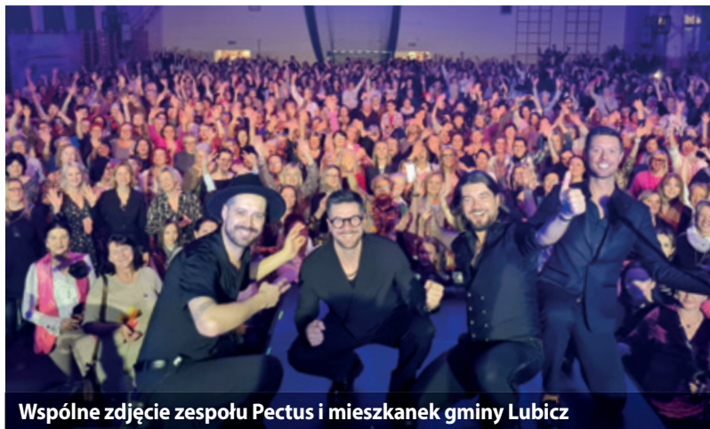
Wspólne zdjęcie zespołu Pectus i mieszanek gminy Lubicz