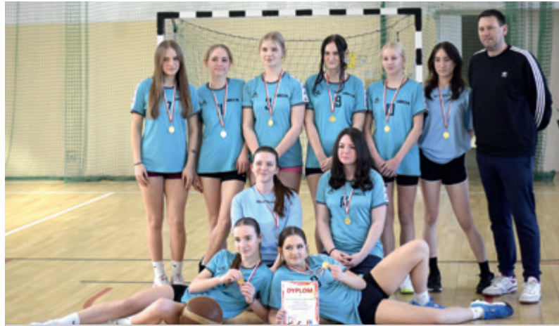
Na zdjęciu najlepsze w koszykówkę uczennice z Lubicza Górnego.