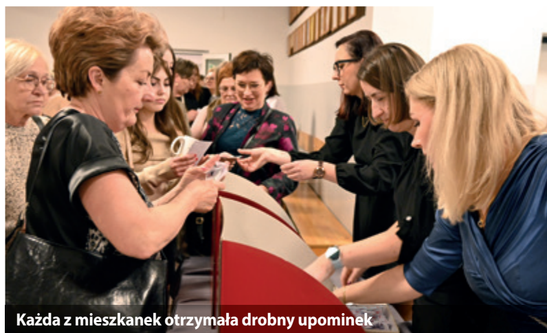
Każda z mieszanek otrzymała drobny upominek