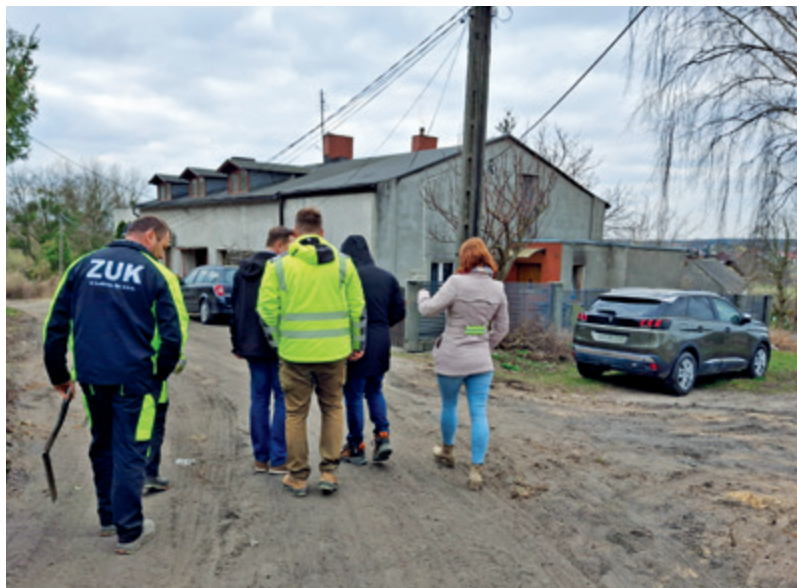
Odbiór kanalizacji sanitarnej w ul. Bocznej i Zdrojowej w Lubiczu Górnym odbył się 24 marca.

Gmina zakończyła budowę kanalizacji na ulicy Zdrojowej i Bocznej w Lubiczu Górnym oraz Osiedlowej w Krobi. Można zacząć z niej korzystać. Co należy zrobić? Wyjaśniamy.