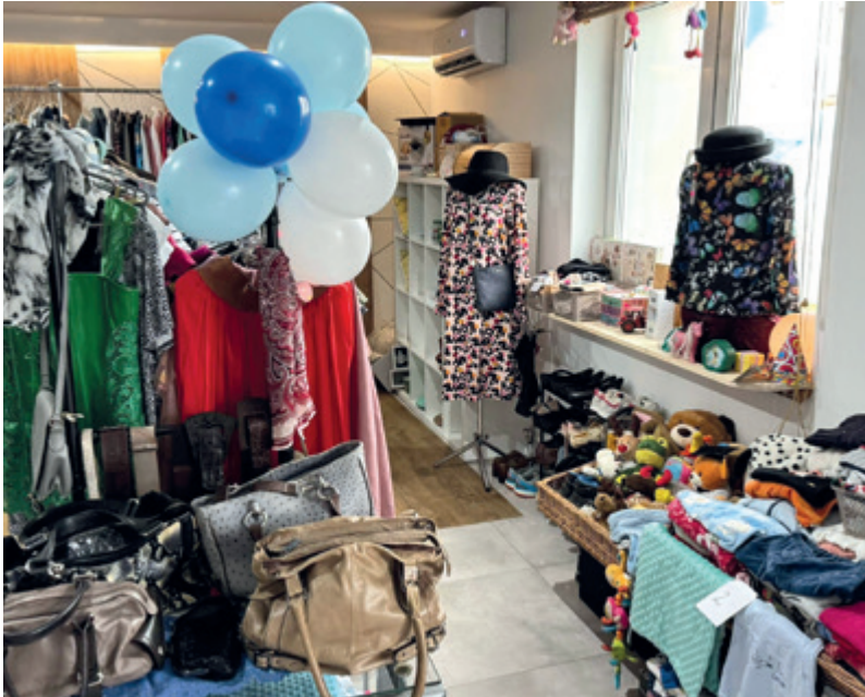
Sklep mieści na ul. Lipnowskiej 50 w Lubiczu Górnym i czynny jest pod poniedziałku do piątku w godz. 9.00-17.00.

W gminie Lubicz, jako jednym z pierwszych samorządów wiejskich w Polsce, powstał sklep charytatywny. Co to takiego?