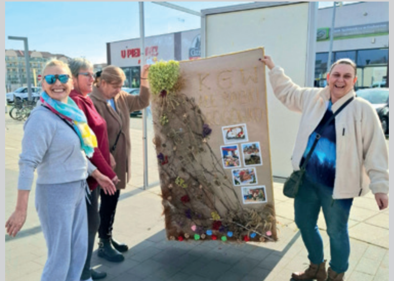
Wiosna zagląda do nas z każdej strony, co ogromnie cieszy, ponieważ nie mogliśmy się jej doczekać. Jest także tematem wystawy, którą można oglądać na pl. Niepodległości w Lubiczu Górnym. To efekt zaangażowania pań z 16 kół gospodyń wiejskich z naszej gminy, które poświęciły swój czas, by zaprezentować mieszkańcom piękne, kolorowe prace.