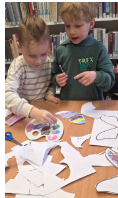
Zajęcia biblioterapii w filii biblioteki w Grębocinie.