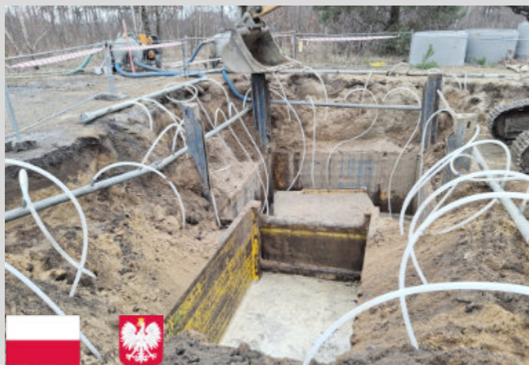
Kontynuujemy, rozpoczętą w ubiegłym roku, budowę kanalizacji sanitarnej w Złotorii, na którą gmina Lubicz otrzymała dofinansowanie z Krajowego Planu Odbudowy. Obecnie roboty są wykonywane przy ul. Sokolej, Starej Baśni, Malowniczej i Bursztynowej. Wartość inwestycji, która powinna być gotowa do maja, to ponad 3,1 mln zł. Na zdjęciu: komora przepompowni ścieków w ul. Starej Baśni.