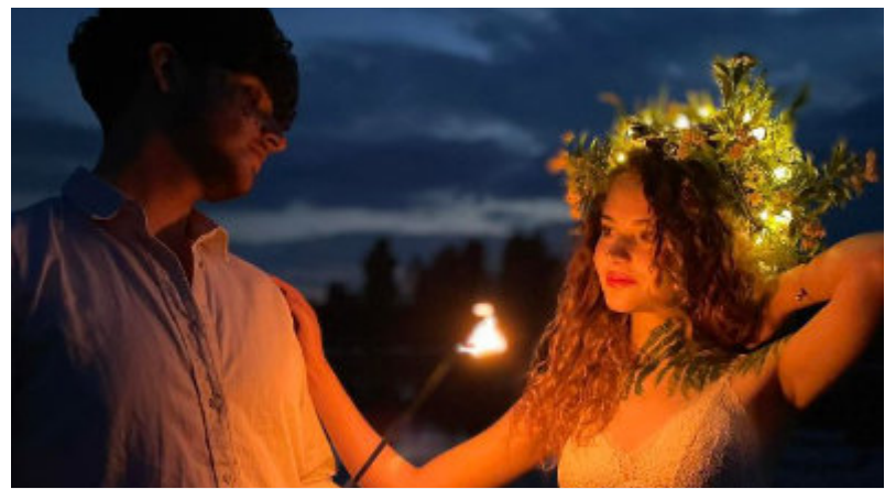
W najkrótszą noc w roku nad Drwęcą powrócimy do dawnych tradycji puszczania wianków.

W piątek 19 czerwca Lubicz Górny stanie się miejscem wyjątkowego spotkania z dawną słowiańską tradycją. Na polach przy młynach odbędzie się plenierowe święto Nocy Świętojańskiej z muzyką i ogniem.