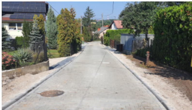
Do sieci swoje domy mogą już podłączać mieszkańcy Bocznej i Zdrojowej w Lubiczu Górnym.