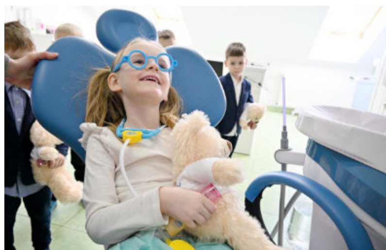
Gabinet rozpoczął działalność na początku marca, a jako pierwsze na fotelu dentystycznym zasiadły przedszkolaki z oddziału w Grębocinie