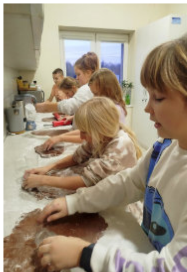
Dzieci, spędzając wspólnie czas, rozwijają także nowe umiejętności.