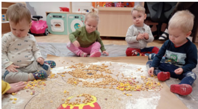
Dzieci z najmłodszej grupy poznają nowe rzeczy poprzez dotyk

Powrót do pracy po urlopie macierzyńskim lub tacierzyńskim to dla wielu rodziców moment pełen emocji. Najważniejsze pytanie brzmi wtedy: czy mój skarb będzie w dobrych rękach?