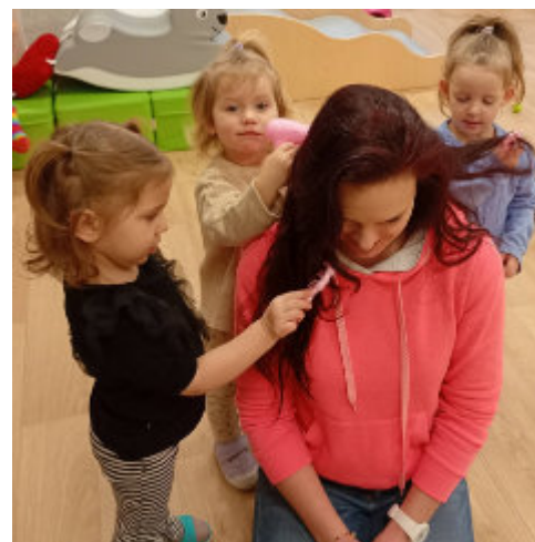
Starsza grupa na wycieczce u fryzjera