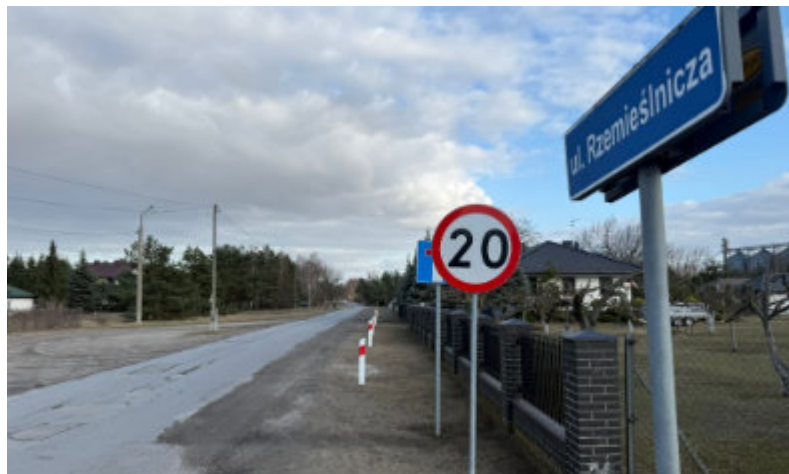
Koszt realizacji ul. Rzemieślniczej w Lubiczu Górnym wyniesie ok. 2,9 mln.

Oba zadania wykona firma REMIKOP Paweł Zieliński Spółka Komandytowa.