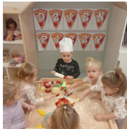
Dzień pizzy w gminnym żłobku