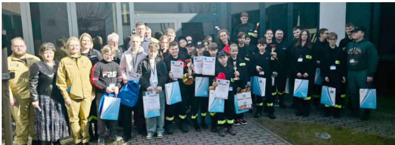
Zdjęcie pamiątkowe z etapu gminnego turnieju w Złotorii.

Druhowie z gminy Lubicz pokazali, że wiedza i odwaga idą w parze! 7 marca w Złotorii odbył się gminny etap Ogólnopolskiego Turnieju Wiedzy Pożarniczej „Młodzież Zapobiega Pożarom”, w którym rywalizowało 27 uczestników w trzech kategoriach wiekowych.