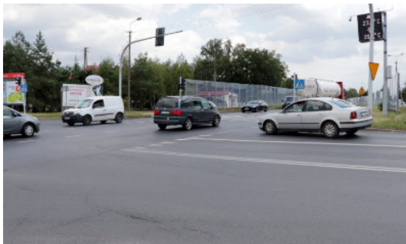
Jedno z rond będzie w Lubiczu Górnym na skrzyżowaniu widocznym na zdjęciu.

Wojewoda wydał decyzje pozwalające na rozpoczęcie rozbudowy drogi w Lubiczu Dolnym i Lubiczu Gór-