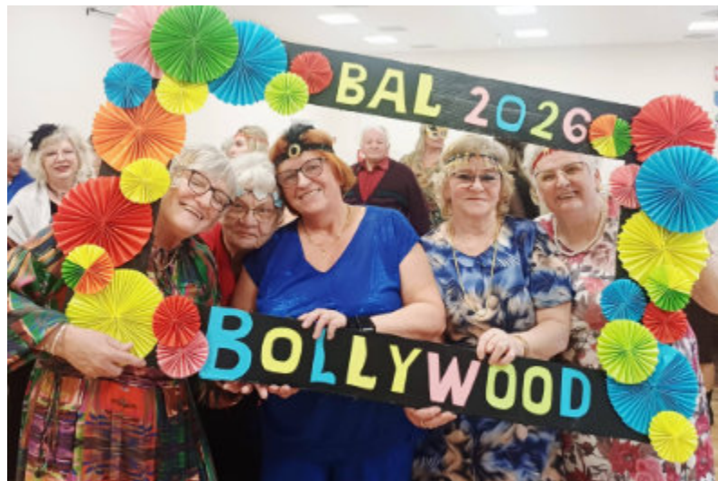
Uczestnicy Dziennego Domu w Gronowie nie tylko biorą udział w zajęciach, ale również świetnie się bawią w swoim towarzystwie.

Podczas pobytu w centrum uczestnicy mają zapewnioną opiekę wykwalifikowanych opiekunów, a także warsztaty terapii zajęciowej oraz zajęcia fizjoterapii.