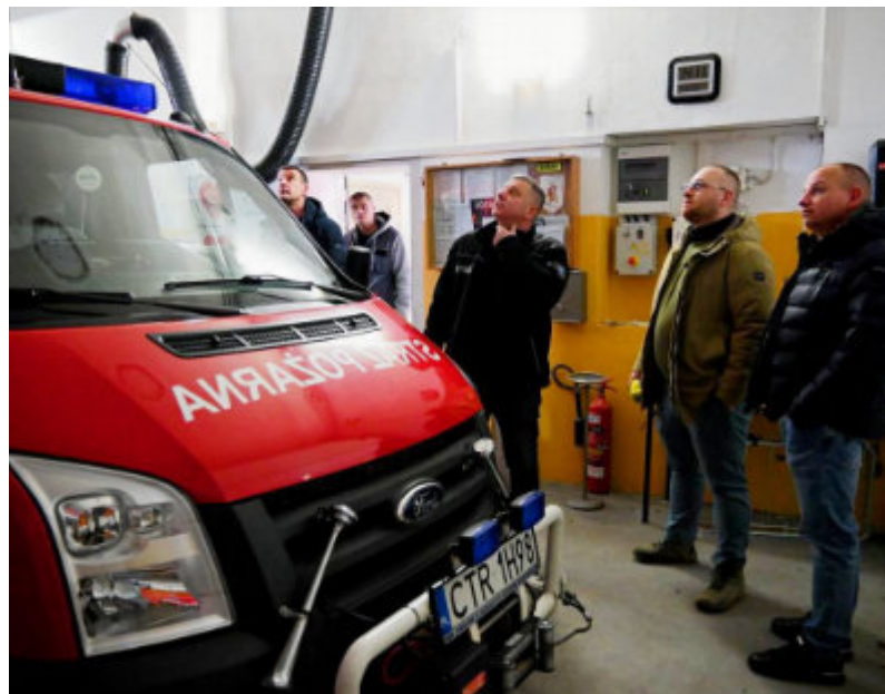
17 lutego budynek strażacki został przekazany wykonawcy