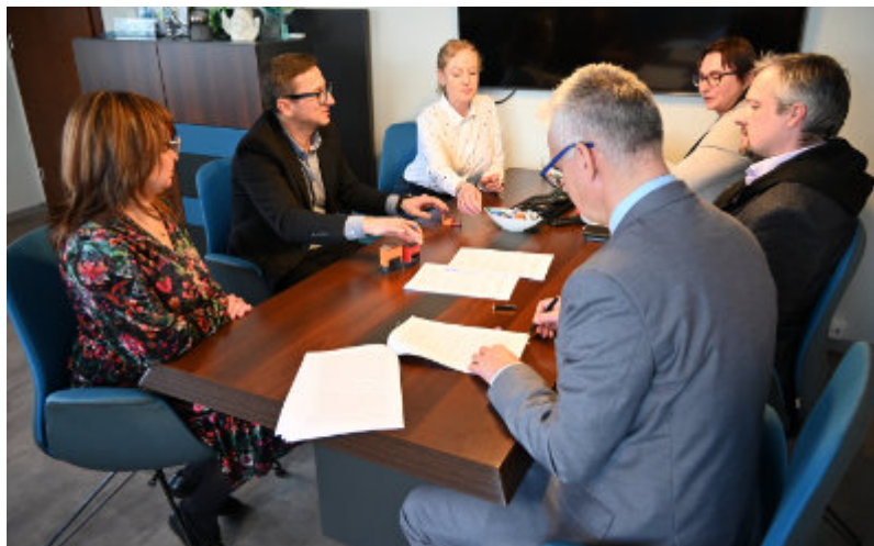
Podpisanie umowy na przebudowę dróg w Złotorii

Bezpieczniej, wygodniej i z myślą o kolejnych latach rozwoju – gmina Lubicz rusza z realizacją czterech ważnych inwestycji drogowych w Lubiczu Górnym i Złotorii.