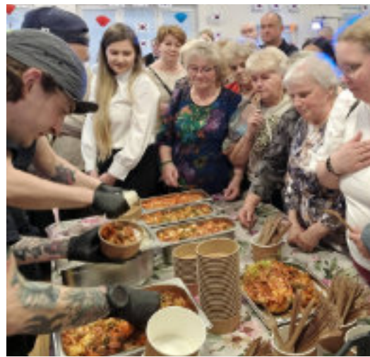
Restauracja „Dwa Stoliki” zaproponowała live cooking i zaserwowała prawdziwe kimchi

Koreańska muzyka, tradycyjne tańce, kuchnia i opowieści – tak wyglądał „Przystanek Korea” w Lubickiej Przystani Integracji.