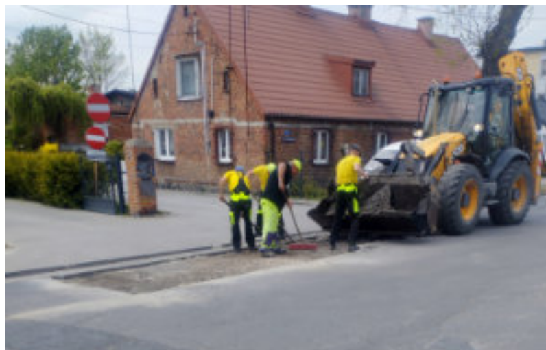
„Łatanie dziur” w Lubiczu Dolnym.