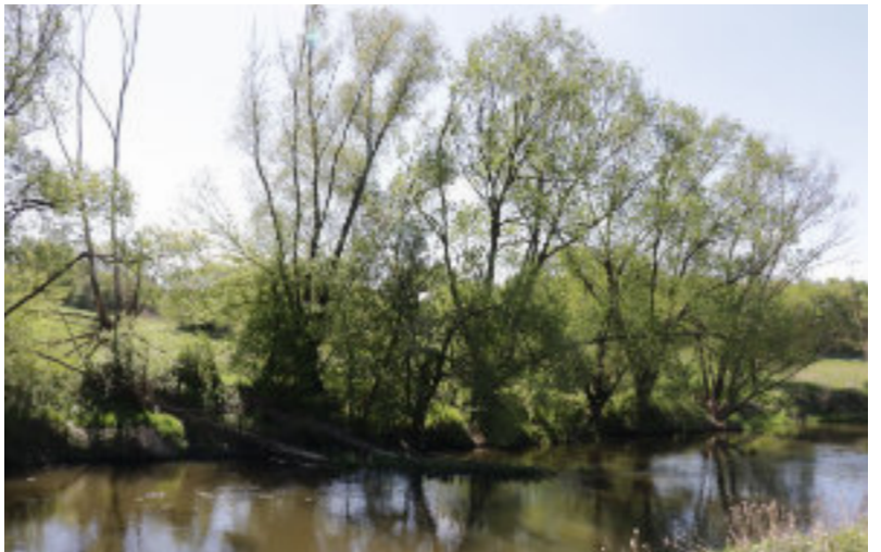
Miejsce, gdzie powstanie nowy most (od strony Lubicza Dolnego)