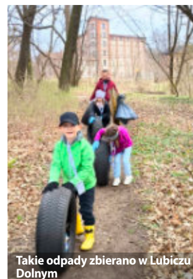
Takie odpady zbierano w Lubiczu Dolnym