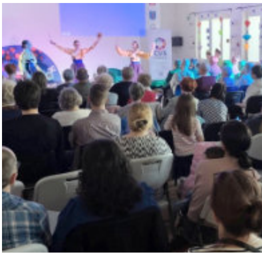
Pokaz tańca z wachlarzami