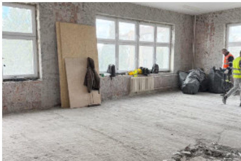
Wszystkie pomieszczenia zostaną gruntownie wyremontowane.