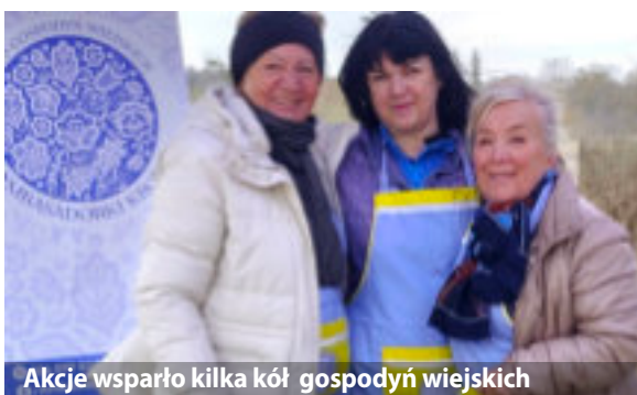
Akcje wsparło kilka kół gospodyń wiejskich