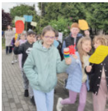
Akcja promocji czytelnictwa „Czytam z marszu”