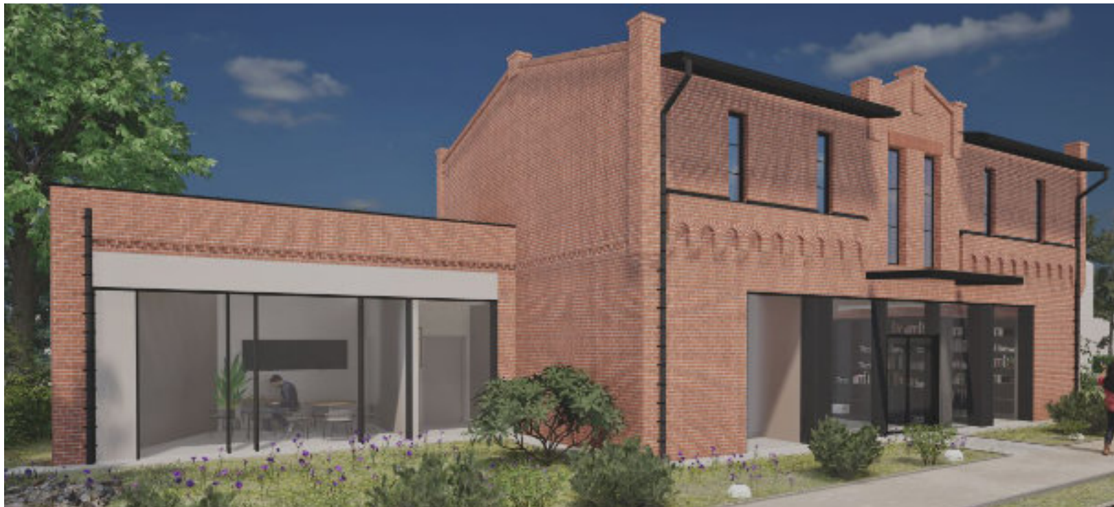
Wizualizacja pierwszej w historii gminy własnej siedziby biblioteki publicznej

Przy ul. Grębockiej 1 powstanie nowoczesne centrum książek, z wydzielonym miejscem rozwoju najmłodszych, przez strefę spotkań młodzieży, po przestrzeń wydarzeń dla całej społeczności.