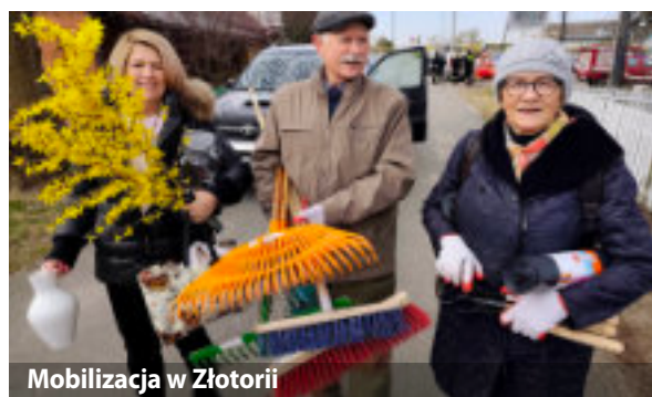
Mobilizacja w Złotorii