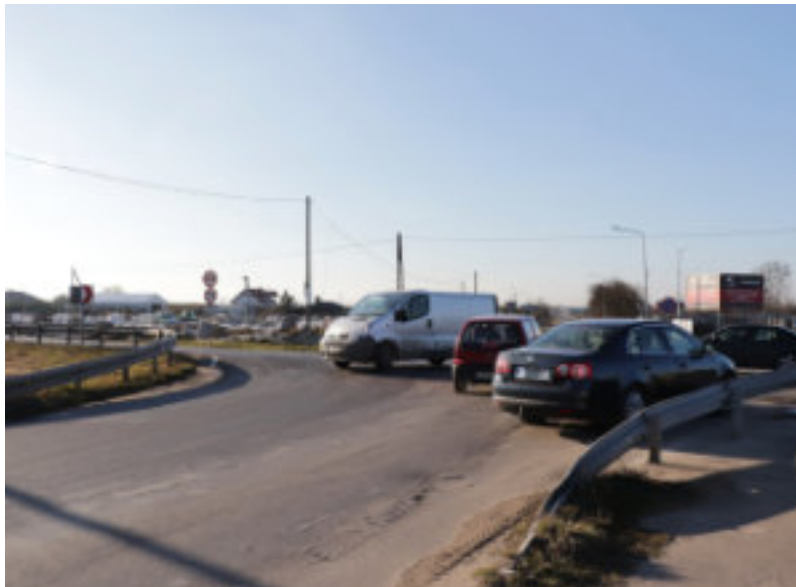
Niebezpieczne dla pieszych skrzyżowanie z krajową „piętnastką”

Generalna Dyrekcja Dróg Krajowych i Autostrad poinformowała w kwietniu o zabezpieczeniu blisko 3 mln zł na budowę chodnika przy DK 15 wraz z przejściem dla pieszych.