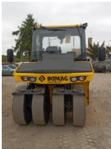
... i nowy walec.