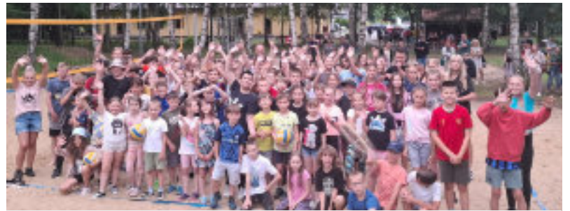
Pierwsza, ubiegłoroczna edycja cieszyła się dużym zainteresowaniem.

Nowością tegorocznej edycji są zajęcia AZS UMK sekcji wioślarskiej z wykorzystaniem ergometrów oraz propozycje przygotowane przez Centrum Ruchu i Rozwoju YogArt, oferujące różne style taneczne np. jazz, latino i breakdance. W harmonogramie pojawi się również hokej na trawie prowadzony przez HK Rustico Pomorzanie Toruń.