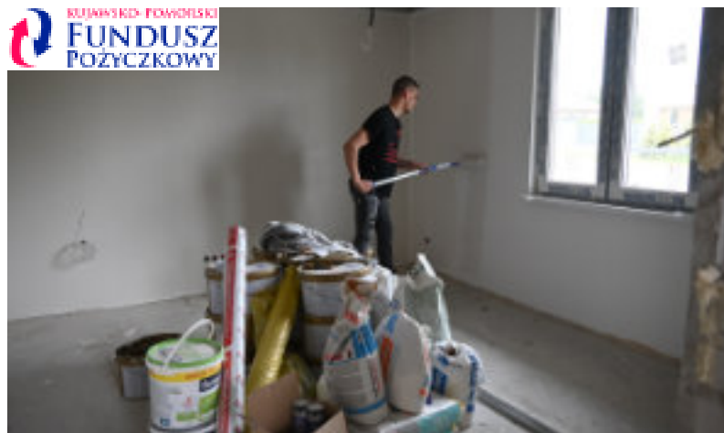
Prace wykończeniowe w pomieszczeniach świetlicy