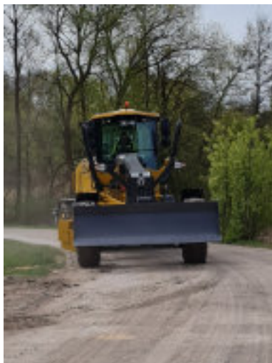
Nowa równiarka...

Pod nr 500 280 543 wyślij SMS z lokalizacją oraz krótkim opisem problemu. Można też dołączyć zdjęcie uszkodzenia.