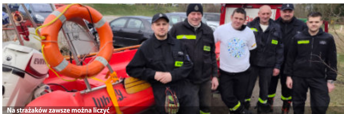
Na strażaków zawsze można liczyć