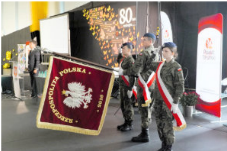
Poczet sztandarowy ZS CKU w Gronowie.

Absolwenci wrócili do dawnych klas, przeglądali szkolne kroniki i wspominali nauczycieli. Zespół Szkół CKU w Gronowie świętował 80-lecie istnienia połączone ze zjazdem absolwentów.