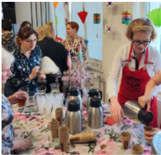
KGW „Swojskie Klimaty” zadbało o podniebienia uczestników wydarzenia