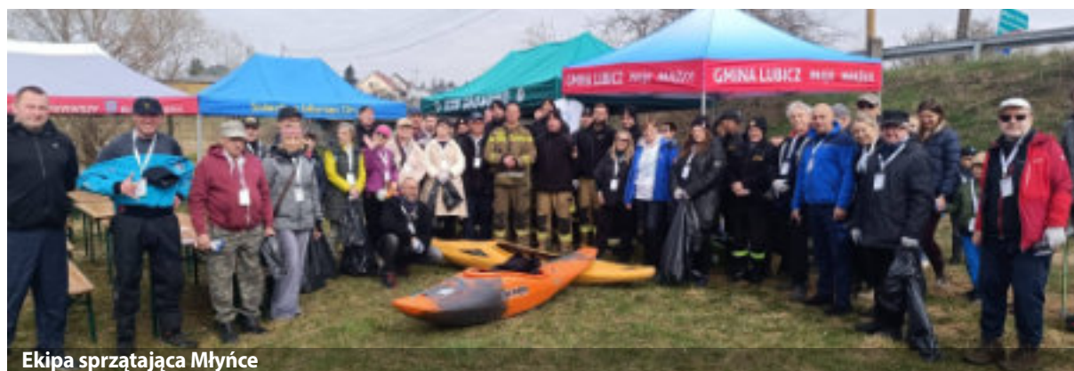
Ekipa sprzątająca Młyńce