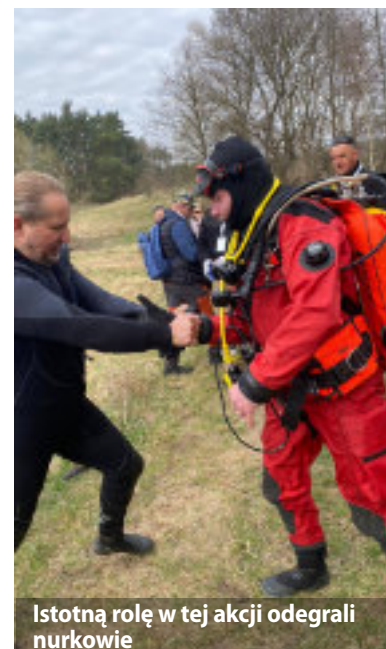
Istotną rolę w tej akcji odegrali nurkowie