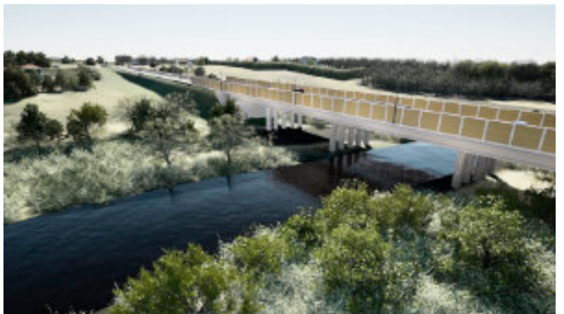
Przeprawa w Nowej Wsi, zarówno pod względem długości, jak i wysokości nad lustrem wody, będzie porównywalna do innych przepraw znajdujących się na naszym terenie – w Młynkach, Lubiczach i Złotorii