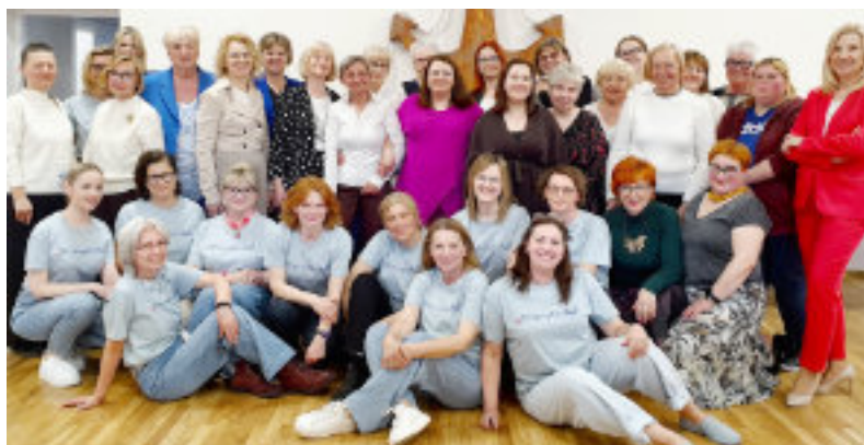
Gminny Zjazd Dyskusyjnych Klubów Książki