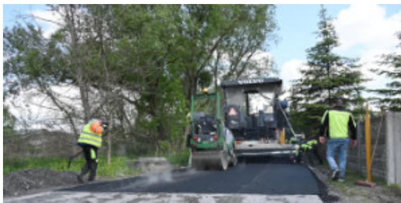
Układanie asfaltu na ul. Orlej w Nowej Wsi