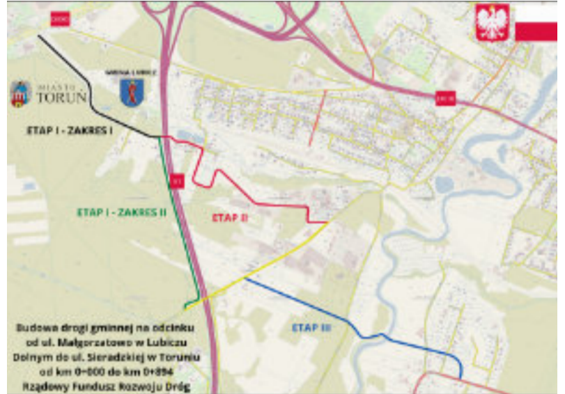
Mapa lokalizacyjna planowanego mostu (etap III) wraz z drogami dojazdowymi (etap I i II)

Kolejny etap realizacji zadania pn. „Budowa obiektu mostowego wraz z drogą dojazdową klasy „L” na odcinku od ul. Małgorzatowo do DW nr 657 w No-