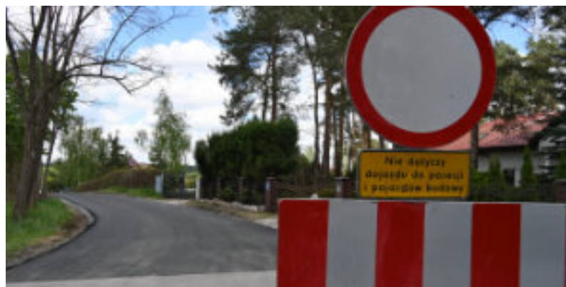
Ulica Wierzbowa w Kopaninie