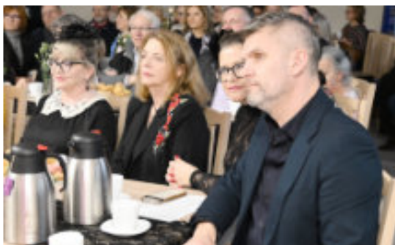
Wieczór poezji i piosenki francuskiej