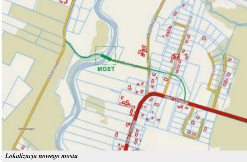
Lokalizacja nowego mostu

Gmina Lubicz otrzymała pozwolenie na realizację inwestycji drogowej dotyczące budowy mostu, który połączy Lubicz Dolny z Nową Wsią.